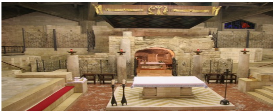
“EUCARISTIA EN NAZARETH”

Desayuno en el hotel. Salida hacia la ciudad de HAIFA. Contemplaremos la magnífica vista de la ciudad, la bahía y el puerto, desde el Monte Carmelo. Visita de Stella Maris, primero y principal santuario de la Virgen del Carmen en el mundo. Atravesaremos la región de Galilea y llegaremos a NAZARETH, lugar de la Encarnación y donde Jesús vivió y creció junto a María y José. Almuerzo. Por la tarde, visita de la Cripta y la Basílica de la Anunciación, Iglesia de San José, museo y Fuente de la Virgen. Continuación hacia TIBERIADES. Llegada, cena y alojamiento en el Hotel Leonardo Club.